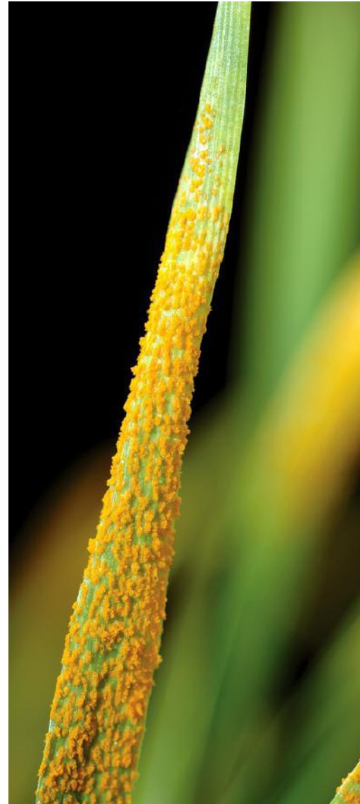
▲ Symptômes de la rouille jaune sur feuille de blé