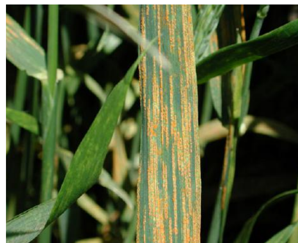
▲ Symptômes de la rouille jaune sur feuille de blé