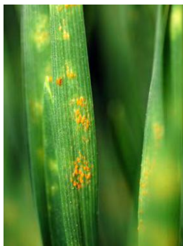
▲ Symptômes de la rouille jaune sur feuille de blé