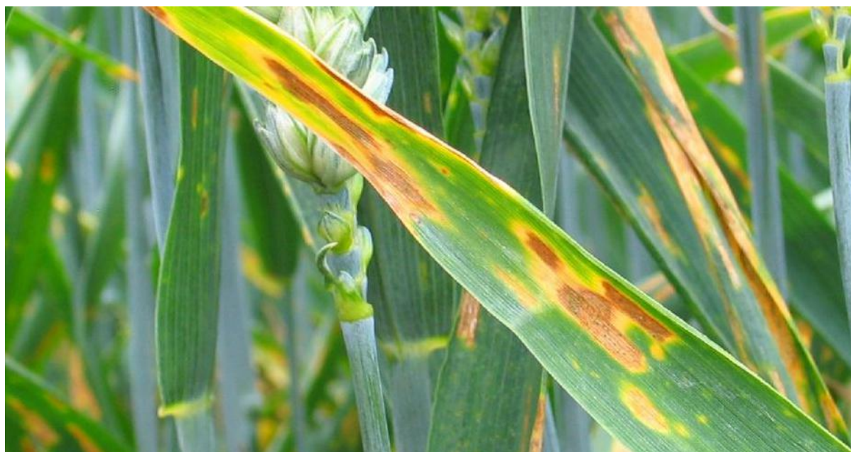
▲ Symptômes de septoriose ( Mycosphaerella graminicola ) sur blé.